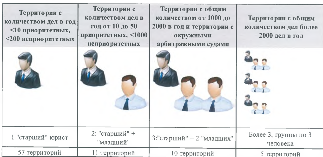
Табл. 9-1 Модель юридического отдела

9.1.1. В 57 территориальных управлениях с небольшим количеством дел рекомендуется предусмотреть 1 штатную единицу юриста, закрепленного за судебной работой. Следует отметить, что при таком распределении часть юристов будут полностью загружены судебной работой, часть юристов (по небольшим теруправлениям) будут не полностью загружены судебной работой. По таким теруправлениям рекомендуется привлечь юристов также к работе с иными задачами, четко определив это в должностных инструкциях. Модель «одно теруправление – один юрист» имеет риск, связанный с тем, что при увольнении работника теруправление остается без юридического ресурса. Для минимизации риска важно предусмотреть обязательный порядок взаимозаменяемости юристов из разных теруправлений по всем 57 территориям (по «кустовому» принципу). Рекомендуется зафиксировать алгоритм взаимозаменяемости исполнителей в системе. Подразумевается, что все юристы пофамильно отмечены в системе (вакансии также отмечены) и алгоритм взаимозаменяемости должен работать автоматически. Необходимо также заранее предусмотреть алгоритм выдачи необходимых доверенностей. Экспертами обсуждалась также модель консолидации юридического ресурса в 10 субъектах (по месторасположению окружных арбитражных судов). В связи с тем, что у всех теруправлений существует потребность в юридическом ресурсе, экспертами было принято решение в данных экспертных рекомендациях сценарий консолидации не рассматривать.